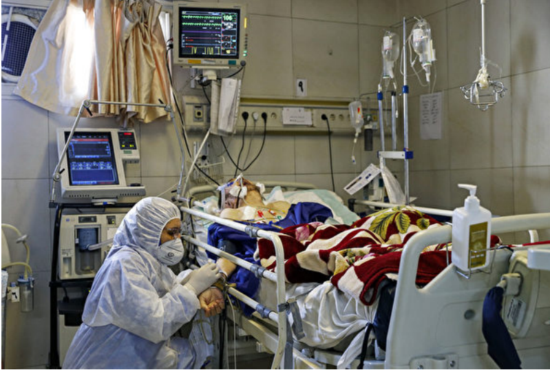
图为一家伊朗医院治疗新冠肺炎患者。(KOOSHA MAHSHID FALAH/MIZAN NEWS AGENCY/AFP)

而中国的抗疫经验被指是官方控制下的“维稳游戏”。武汉疫情爆发初期，由于中共隐瞒导致疫情失控，使其成为蔓延全球的瘟疫。近期，中共党媒连日宣传中国的武汉肺炎疫情缓和，甚至连武汉新增病例也出现清零，但武汉当地一位医生家属3月9日对海外新唐人电视台披露，汉阳连着成片的几个小区又再次爆发大规模感染，中共官方没有通报这个消息。