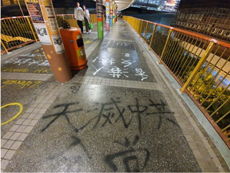
2019年11月2日，在香港红磡地铁外的行人天桥，“天灭中共”的喷字。