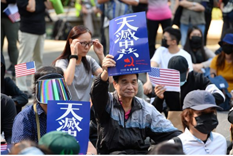
2019年12月1日，香港民众在中环遮打花园举行“感谢美国保护香港”大游行。图为民众举起天灭中共的标语表达诉求。