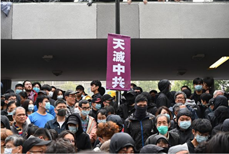
2020年1月19日，“天下制裁集会”在中环遮打花园及遮打道举行。人群中“天灭中共”的旗帜相当鲜明。