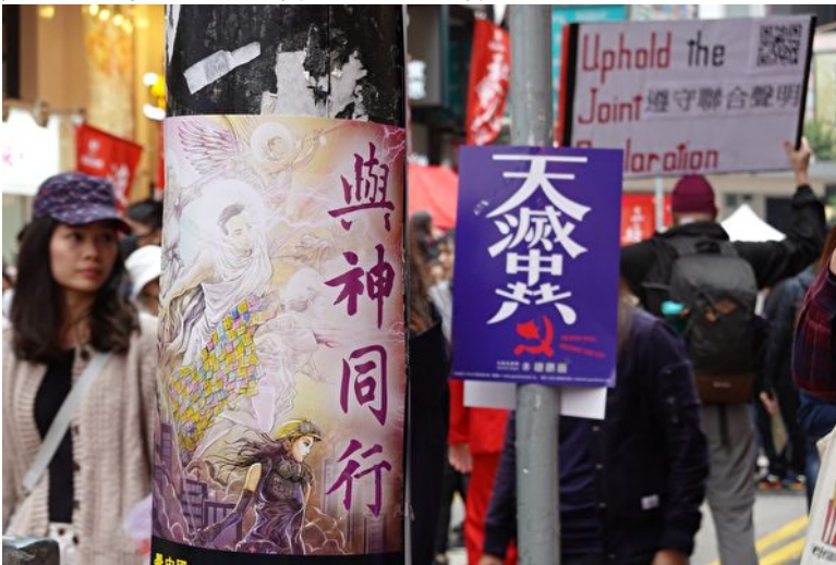
2020年1月1日，香港元旦由民间人权阵线（民阵）举办“元旦大游行”，下午2时在维园集合。不到两点，铜锣湾已见参与游行的大批市民，天灭中共标语大受欢迎。