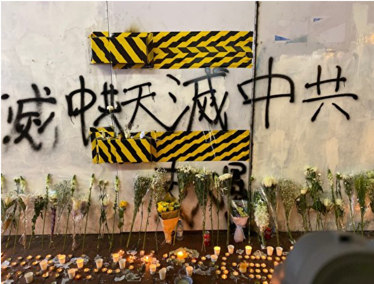
2019年11月8日晚，香港民众在旺角墙壁喷“天灭中共”。（文瀚林 / 大纪元）