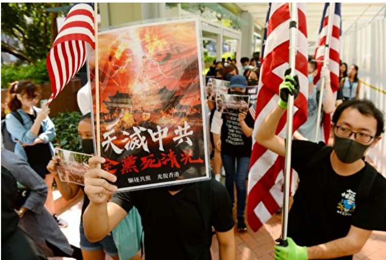
2019年9月20日，港大美国旗队手持“天灭中共”标语，请求美国支持香港民主运动，通过《香港人权与民主法案》。