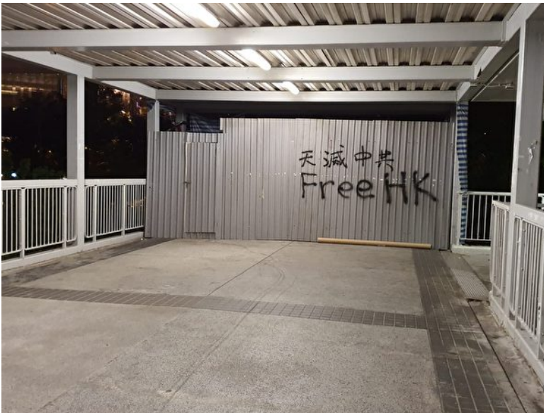
2019年11月1日，香港立法会行人桥，“天灭中共”的喷字。