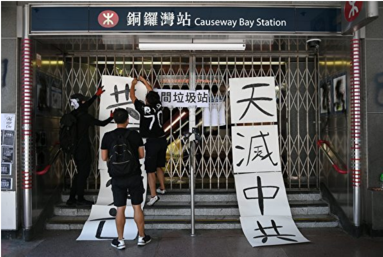
香港街头标语“天灭中共”令中共极度恐惧。图为10月1日香港“没有国庆 只有国殇”游行，有抗争者在关闭的铜锣湾地铁站口布置标语牌“天灭中共”。(Mohd RAS-FAN/AFP)